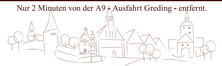
Nur 2 Minuten von der A9 - Ausfahrt Greding - entfernt.